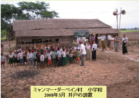
ミャンマー・ダーベイン村 小学校 2008年3月 井戸の設置

船橋ロータリークラブは、国内や海外のみなさんのお役にたてる活動をしている団体です。