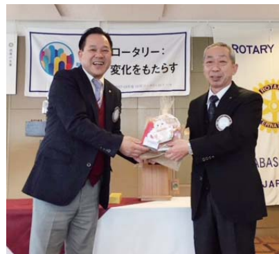
夫人誕生 山口会員