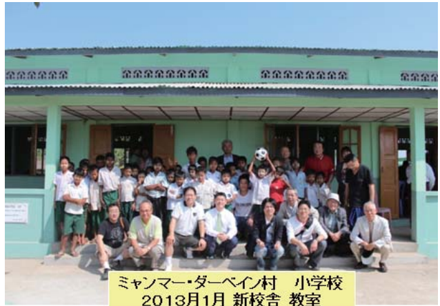
ミャンマー・ダーベイン村 小学校 2013年1月 新校舎 教室