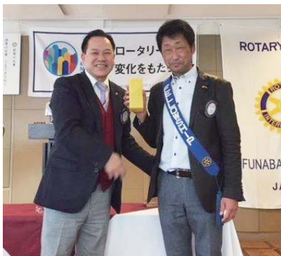
会員誕生 草野会員