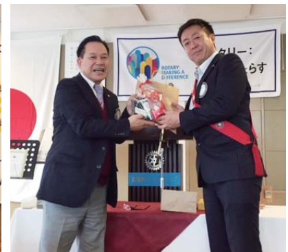
夫人誕生祝い 鯨井会員